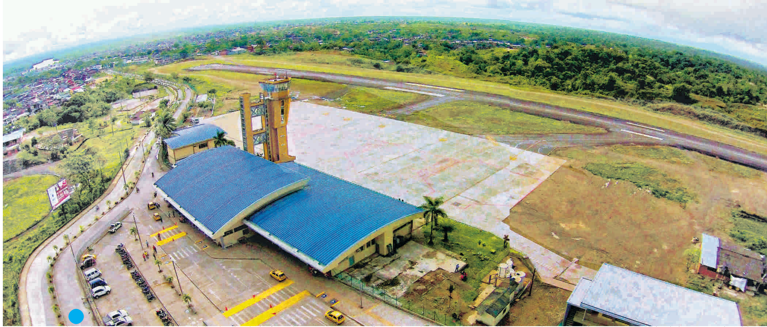
Este es el aeropuerto El Caraño hoy, pero sus instalaciones serán ampliadas, al igual que la plataforma y la pista, para que aterricen allí aviones hasta de 180 pasajeros. Cerca de él harán un centro de servicios con el primer centro comercial y sala de cines que tendrá Quibdó.

A su vez, Codad construye y adecúa calles de rodaje para la salida rápida de los aviones, para que, así, ocupen menos tiempo las pistas.