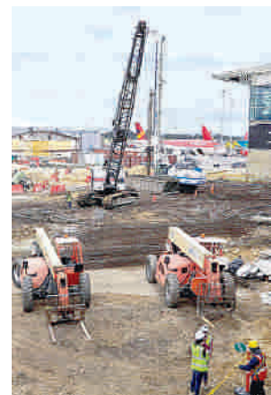
Obras en el muelle nacional de El Dorado.