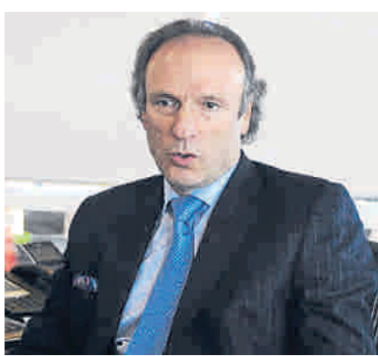
Gustavo Alberto Lenis, director de la Aeronáutica Civil.

Ese es un proyecto que está todavía en implementación. En un ejemplo se resume lo que se está haciendo. Nosotros crecimos el 5 por ciento en las operaciones de El Dorado en el último año, y las aerolíneas han mejorado el cumplimiento en 13 puntos por lo hecho.