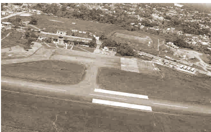
La vieja terminal aérea de Quibdó no tenía franjas de seguridad para los aviones.