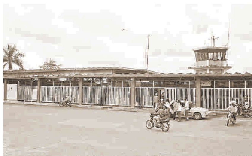
Este era el antiguo aeropuerto El Caraño, que fue demolido para hacer el nuevo.