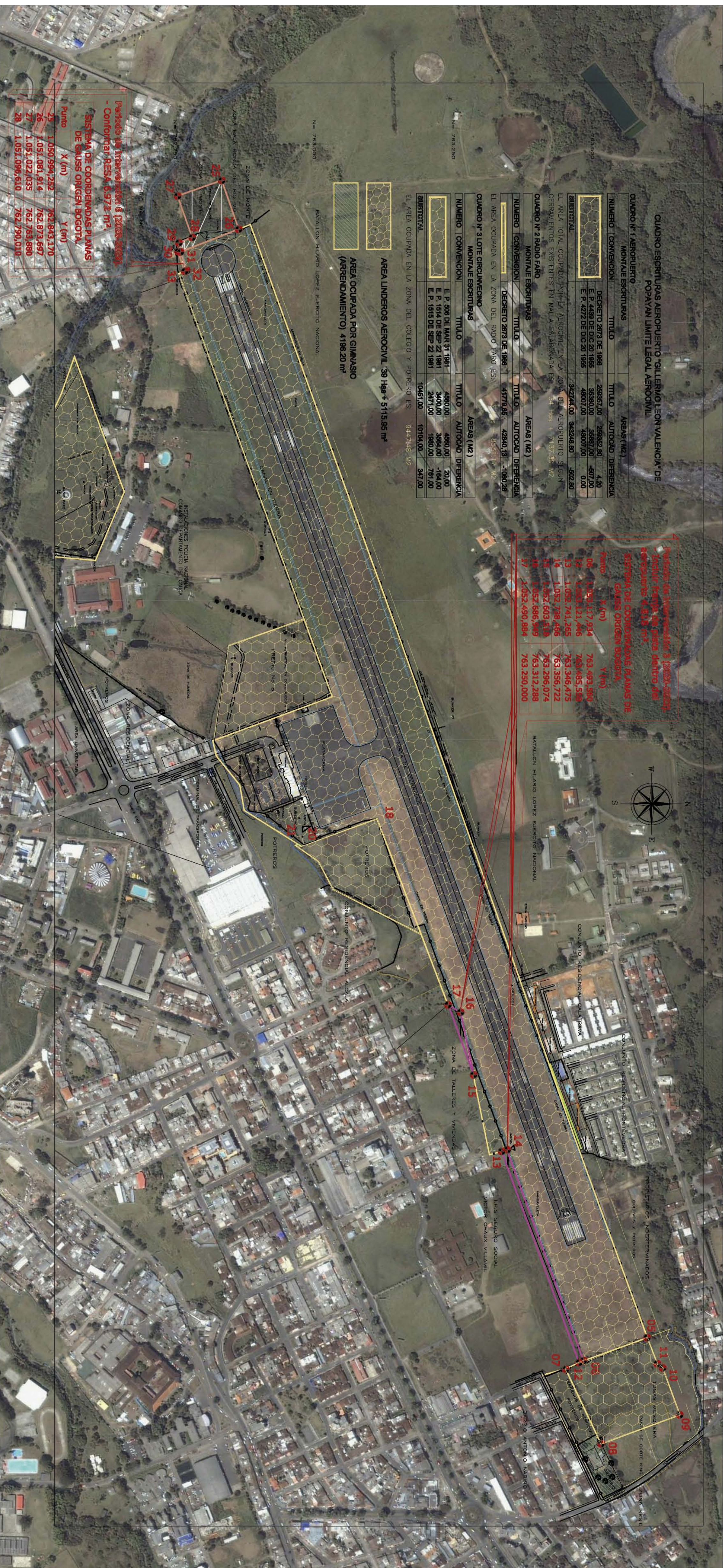
CUADRO ESCRITURAS AEROPUERTO GUILLERMO LEÓN VALENCIA DE POPAYÁN LIMITE LEGAL AEROCIVIL