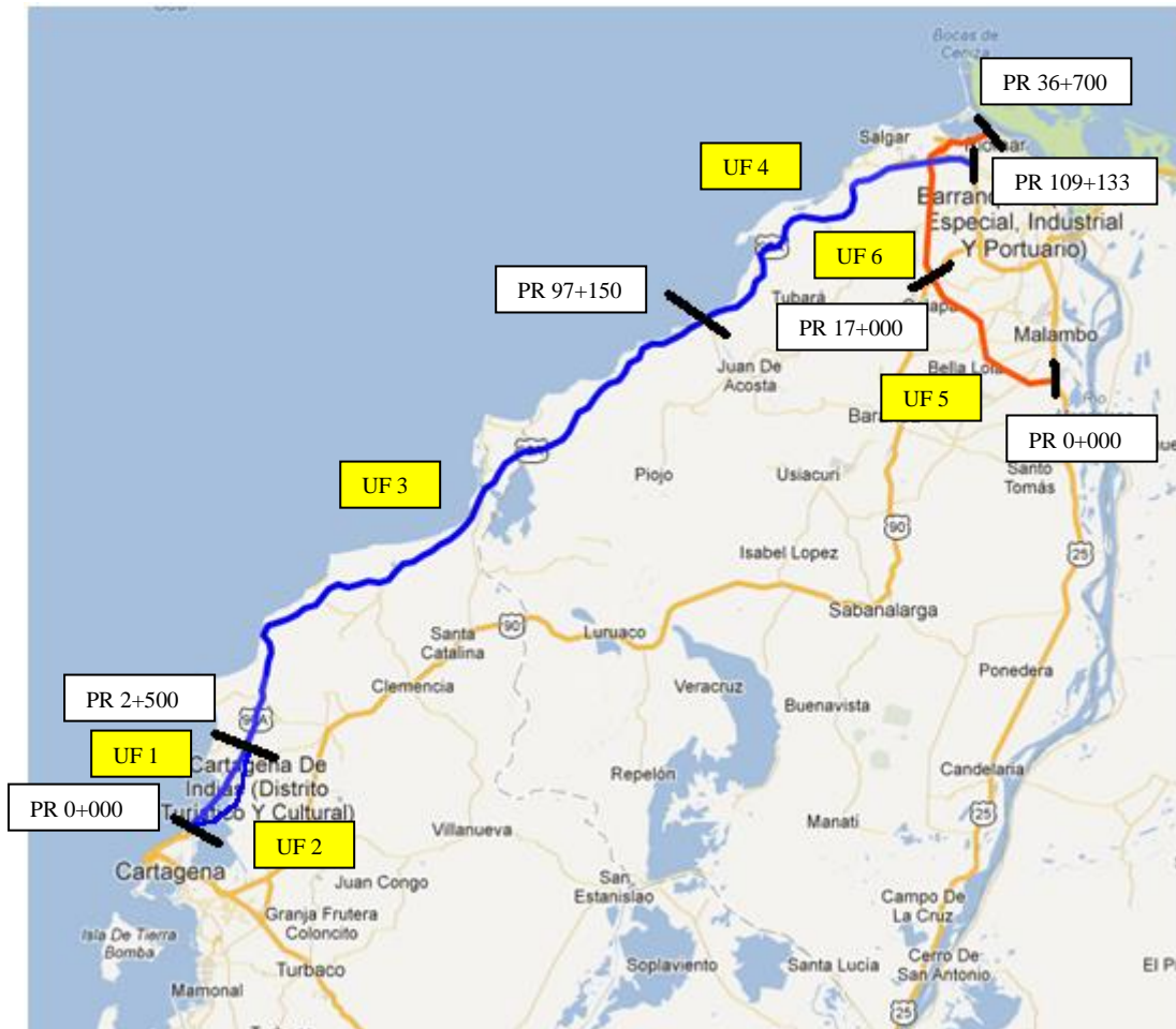
Figura 2 - Localización general de las Unidades Funcionales