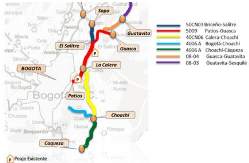
Figura 1 – Localización general del Proyecto