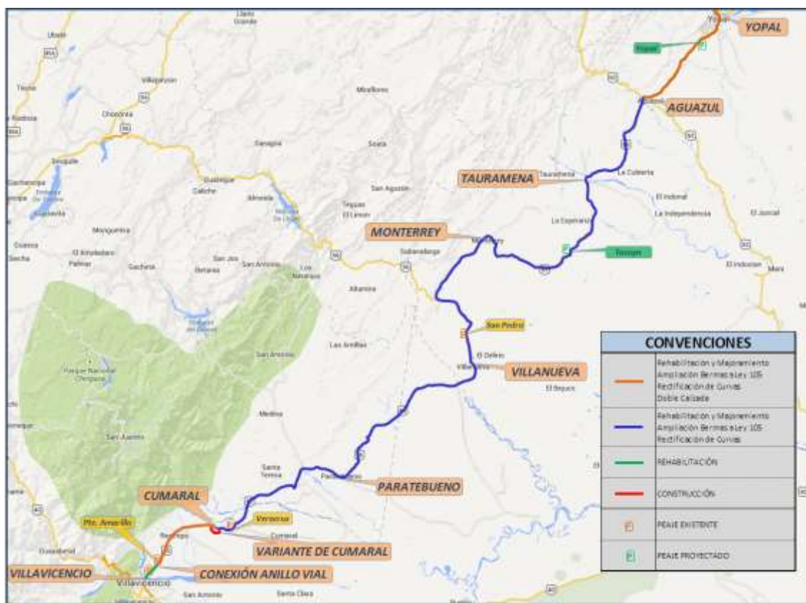
Figura 1 – Localización general e Intervenciones mínimas del Proyecto