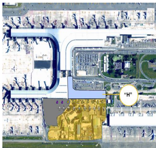
Foto 17. Alternativa de expansión del muelle sur del aeropuerto.

Esta alternativa es conocida como “H”, por la forma que toma el terminal visto en planta. Este proyecto a la fecha tampoco está siendo contemplado dentro de los proyectos en estructuración para satisfacer la demanda aérea futura de Bogotá y su región.