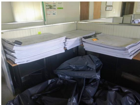
Foto 9. Entrega física de planos récord realizada por el concesionario para revisión de la interventoría.