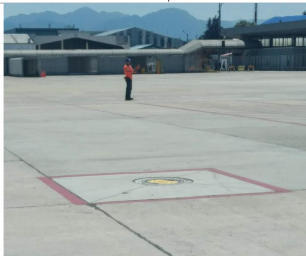
Foto 3. Sistema de Jetducto de la reconfiguración plataforma y sistema de combustibles puente aéreo – TPA.