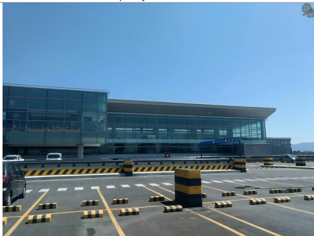
Foto 13. Exterior del muelle norte de la ampliación del terminal de pasajeros T1+T2.

Durante el recorrido al parqueadero norte en altura, se evidenció la fachada de la obra de ampliación del muelle norte del terminal.