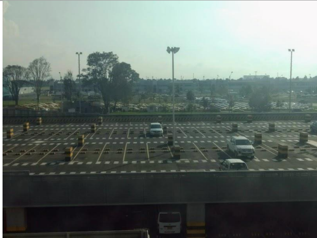
Foto 11. Parqueadero norte en altura.

Desde el muelle internacional se evidenció la operación del parqueadero, así como la ampliación del parqueadero de taxis (al fondo de la foto).