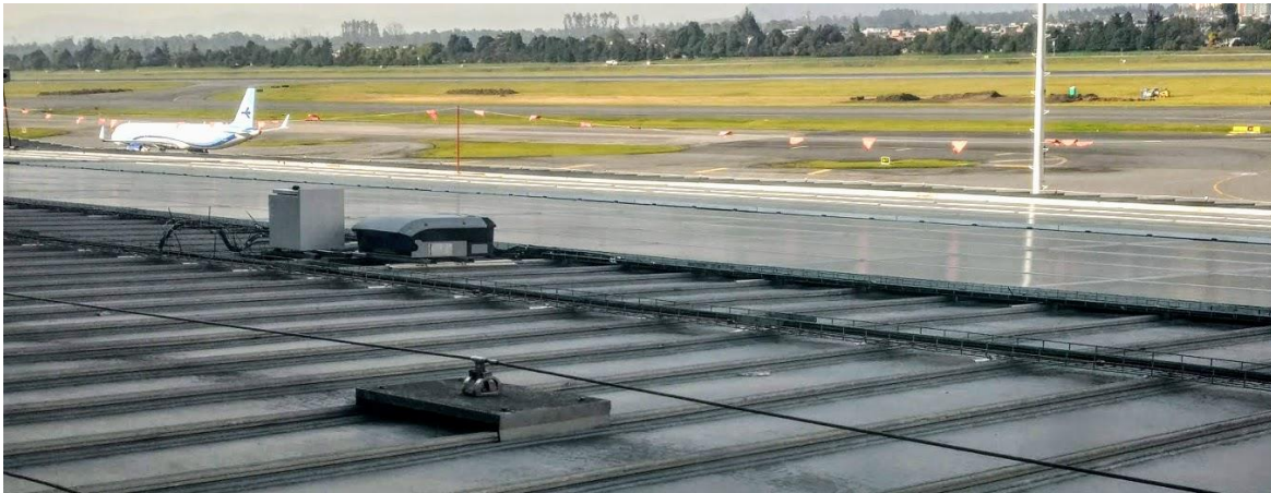
Foto 15. Sistema de autogeneración fotovoltaico.

Durante la visita de auditoría, se evidenció la instalación del sistema de autogeneración fotovoltaico en la cubierta del terminal 1 del aeropuerto. En la fotografía, se puede observar la diferencia entre la cubierta con y sin la instalación del sistema fotovoltaico.