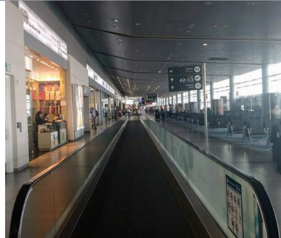
Foto 12. Interior del muelle norte de la ampliación del terminal de pasajeros T1+T2.

Se evidenció la operación con normalidad del muelle internacional, dotado con salas de espera, locales comerciales, cintas transportadoras peatonales.