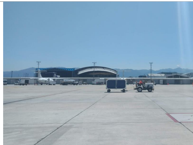
Foto 14. Hangares de Avianca fase II.

En la visita a las obras de reconfiguración de la plataforma del terminal 2 se evidenció la presencia del hangar de Avianca el cual se planea demoler para continuar ampliando esta plataforma.