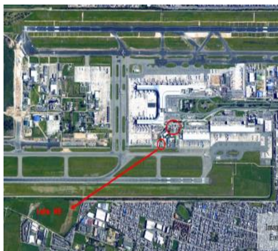
Foto 16. Ubicación actual de los tanques y del lote previsto para la reubicación de los tanques de abastecimiento de combustible.

En la foto, la ubicación actual es la que está al norte de la propuesta. Este proyecto a la fecha no está siendo contemplado dentro de los proyectos en estructuración para satisfacer la demanda aérea futura de Bogotá y su región.