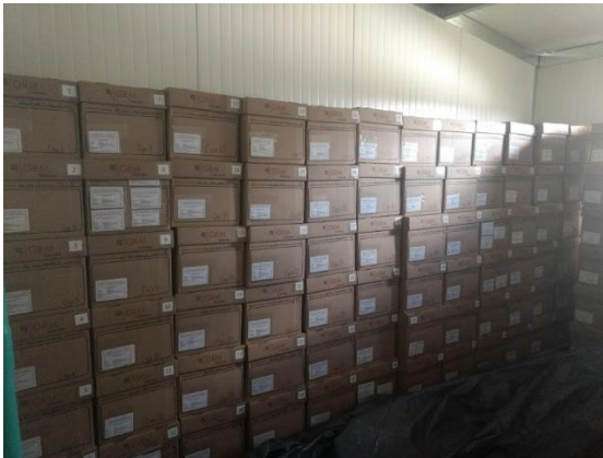
Foto 7 Entrega física de memorias técnicas realizadas por el concesionario para revisión de la interventoría.