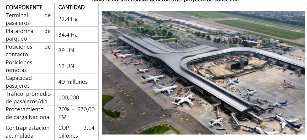
Tabla 3. Características generales del proyecto de concesión