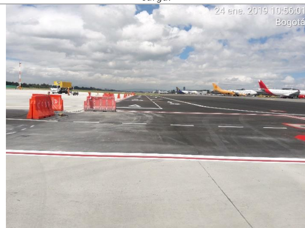
Foto 1. Señalización de plataforma equivalente en el terminal de carga.