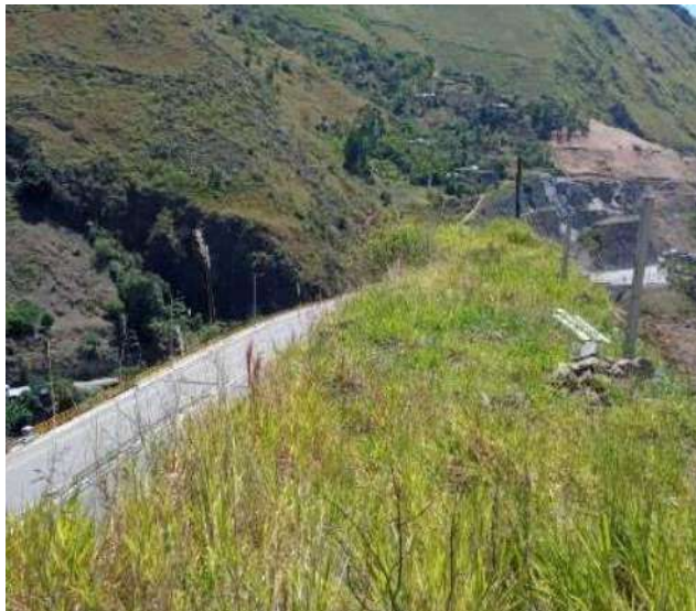
VISTA AREA REQUERIDA