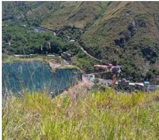
VISTA AREA REQUERIDA