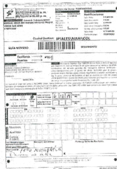
IMAGEN PRUEBA DE ENTREGA DE LA DEVOLUCIÓN