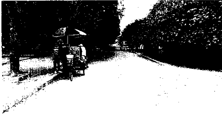
Fotografía 3. Calle 6 desde la carrera 11 hasta la 13. Panorámica 1 calzada de 6 metros con 2 carriles de 3 metros.

Como muestra de transparencia y honestidad que caracteriza a las firmas que conformamos el CONSORCIO NORTE DE COLOMBIA , como RIO ARQUITECTURA E INGENIERÍA S.A. solicitamos la corrección y aclaración de la certificación la cual adjuntamos al presente oficio.