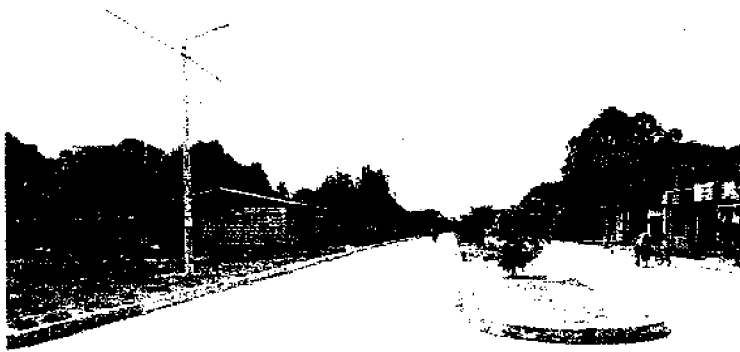
Fotografía 2. Carrera 13 desde la calle 6 hasta la 10. Panorámica 2 calzadas uno por sentido, cada calzada de 6 metros con 2 carriles de 3 metros cada uno.