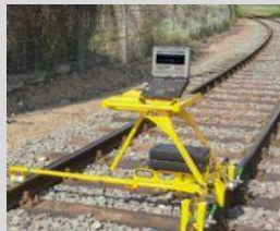
9- Auscultador manual de geometría de vía