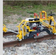
4- Maquina esmeriladora y amoldadora de carril