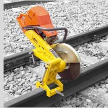
3- Maquina tronzadora de carriles