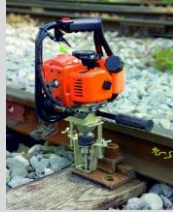
1- Barrenadora de traviesas de madera