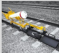
5- Equipo para calentar carriles