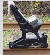
8- Equipo inspector de carril por ultrasonido