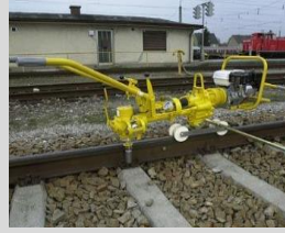
2- Maquina para apretar y/o desatornillar tuercas y tirafondos