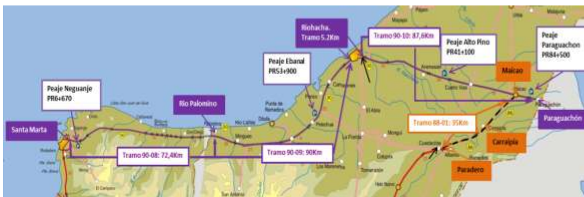
Figura 1. Localización y detalle general del Proyecto – Santa Marta – Riohacha - Paraguachón

El proyecto se localiza en los departamentos de Magdalena y Guajira; comprende la vía nacional que une a Santa Marta con Riohacha y Riohacha con Paraguachón, comprendiendo además el sector Maicao – Carraipía – Paradero (35,13 Km). El proyecto físico está incluido en la ruta nacional 90, e incluye el tramo 08 (Santa Marta – Río Palomino), el tramo 09 (Río Palomino – Riohacha), el tramo 10 (Riohacha – Paraguachón) y el sector 88-01 (Maicao – Carraipía – Paradero), incluyendo en último sector el puente Porciosa.