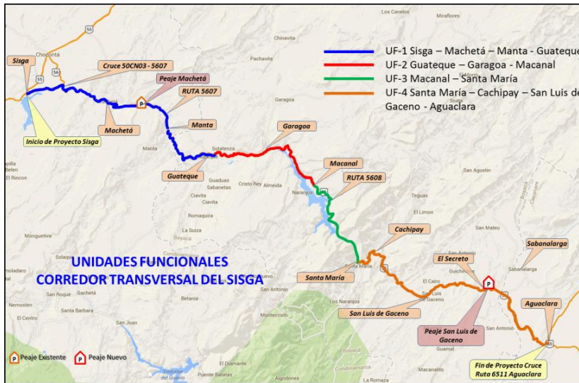
Figura 2 - Localización general de las Unidades Funcionales