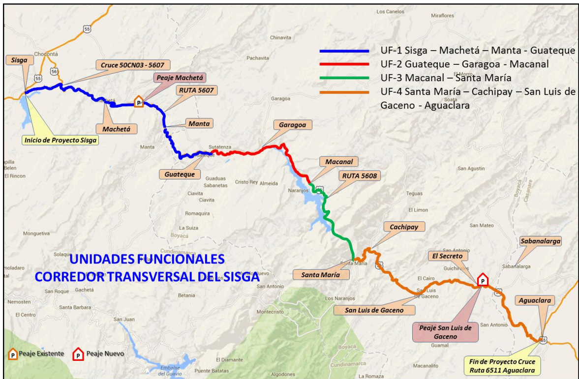
Figura 2 - Localización general de las Unidades Funcionales

Nota: Los Municipios de Manta, Garagoa, Macanal, Cachipay y Aguaclara no quedan directamente sobre la vía y sólo se muestran con el propósito de nombrar los puntos de referencia utilizados para subdividir las Unidades Funcionales del Proyecto en los tramos de vía aledaños a estos Municipios. En cualquier caso, los puntos de inicio y finalización de cada Unidad Funcional serán los establecidos en las tablas de este Apéndice Técnico.