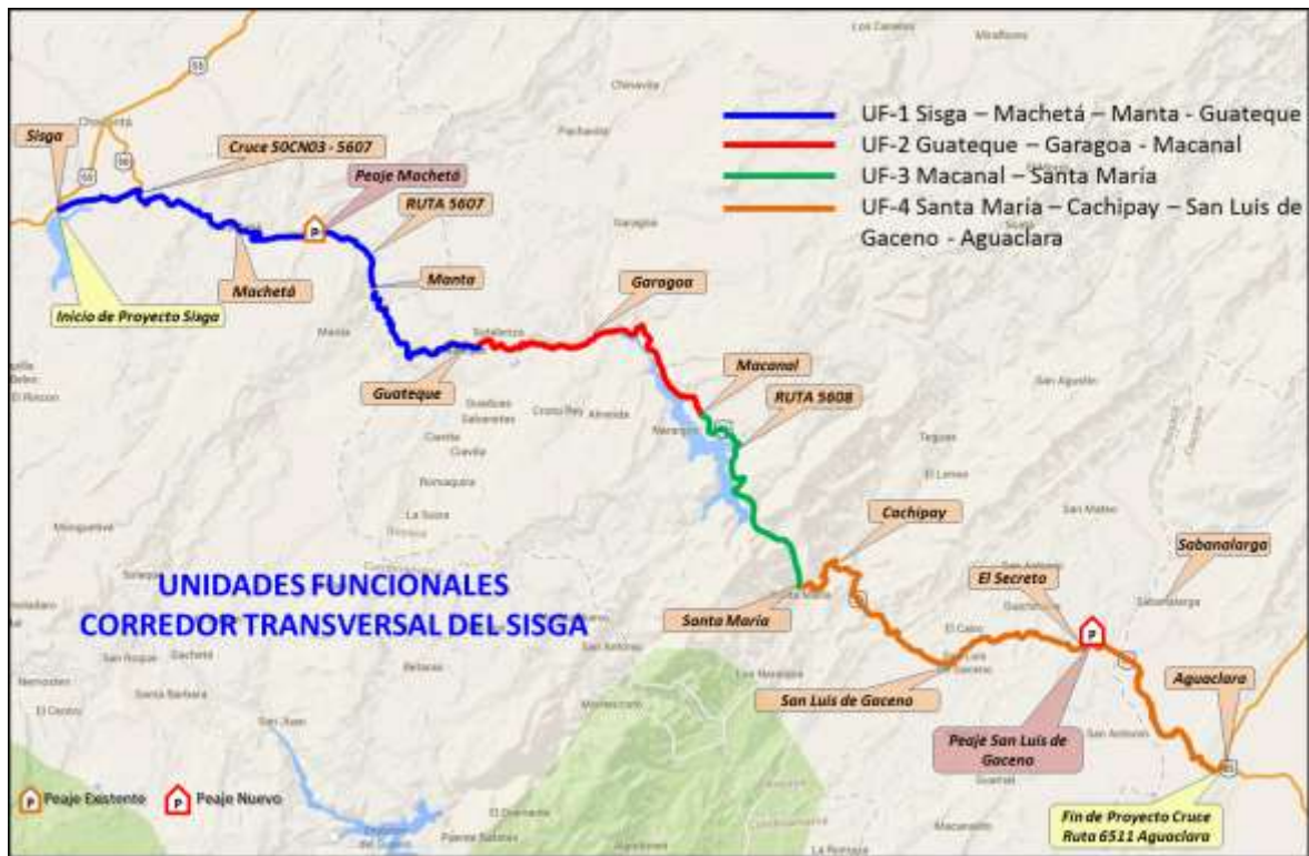
Figura 2 - Localización general de las Unidades Funcionales

Nota: Los Municipios de Manta, Garagoa, Macanal, Cachipay y Aguaclara no quedan directamente sobre la vía y sólo se muestran con el propósito de nombrar los puntos de referencia utilizados para subdividir las Unidades Funcionales del Proyecto en los tramos de vía aledaños a estos Municipios. En cualquier caso, los puntos de inicio y finalización de cada Unidad Funcional serán los establecidos en las tablas de este Apéndice Técnico.