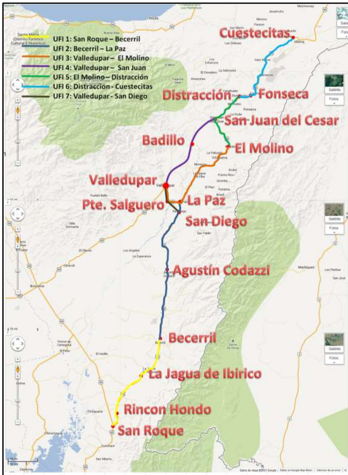
Figura 2 – Localización general de las Unidades Funcionales del Proyecto

(b) La Figura 2, se muestra la localización general de cada Unidad Funcional.