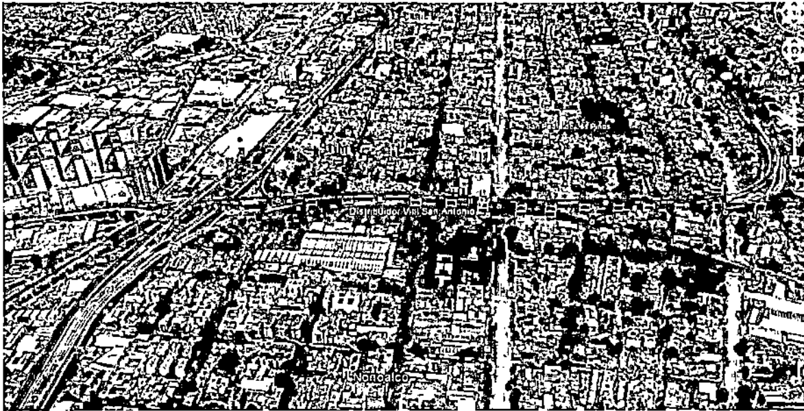
Contrato de Orden 3