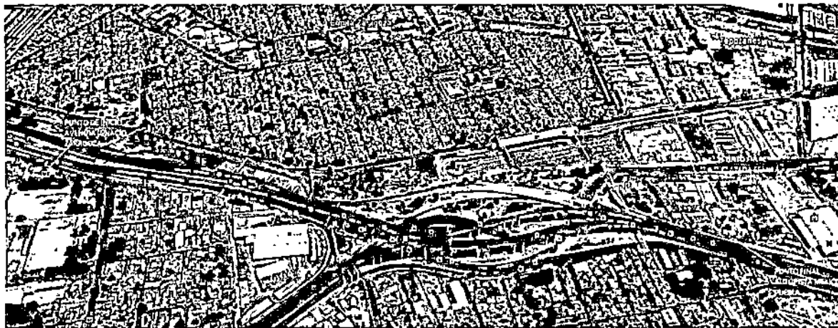
Contrato de Orden 4

Esperamos que la anterior aclaración nos permita continuar con el proceso de evaluación de forma favorable.