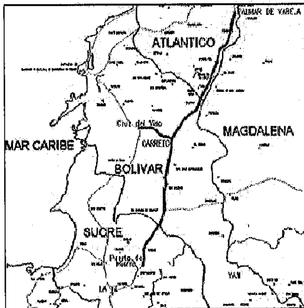
Figura 1 – Localización general del Proyecto

La Figura 1 muestra la localización general del Proyecto.