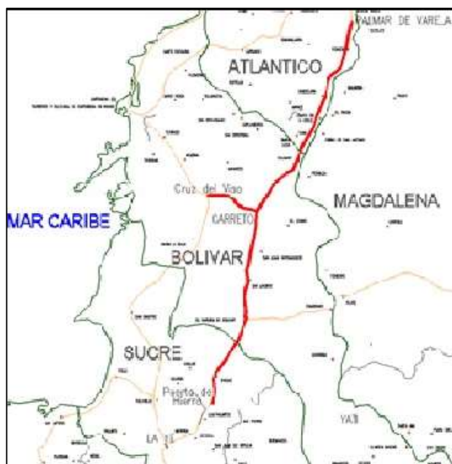
Figura 1 – Localización general del Proyecto

La Figura 1 muestra la localización general del Proyecto.