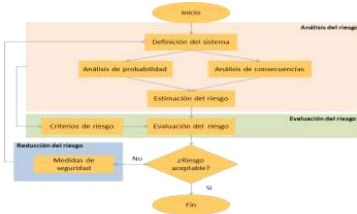
Figura 1 – Diagrama de la gestión del proceso