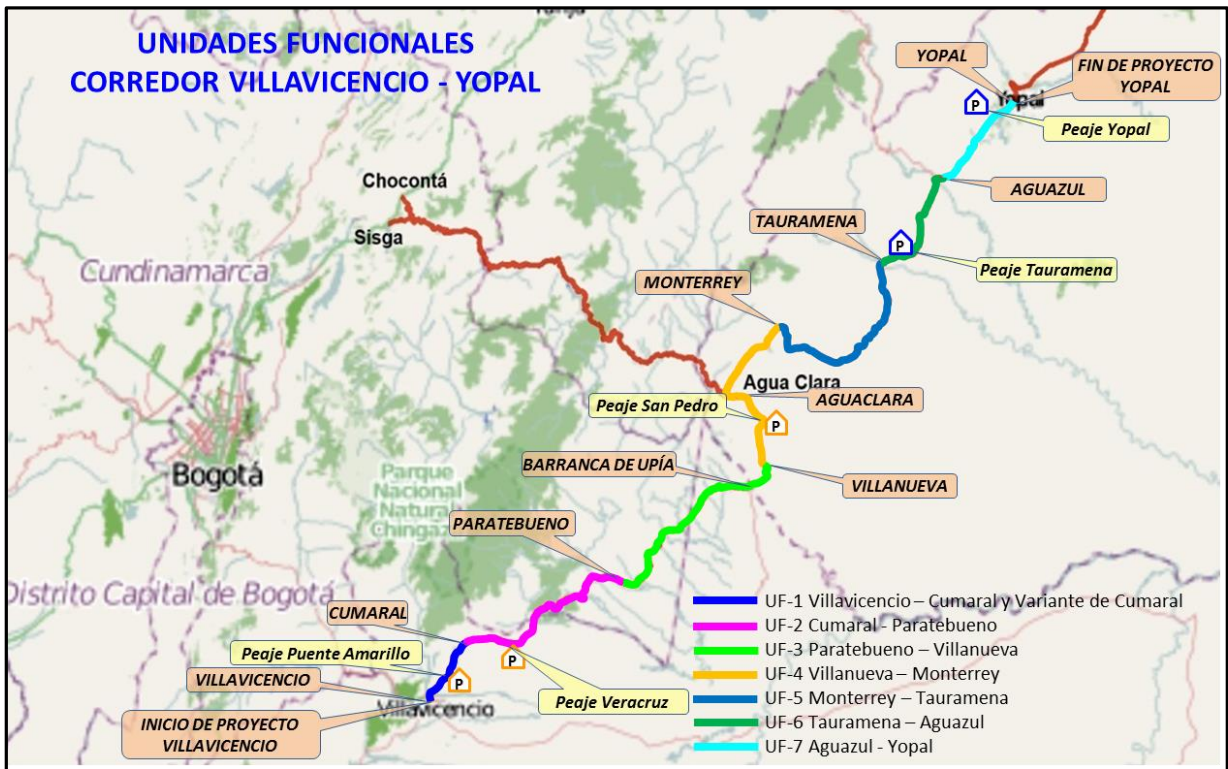
Figura 2 - Localización general de las Unidades Funcionales

Nota: El Municipio de Tauramena no queda directamente sobre la vía y solo se muestra para el propósito de subdividir las unidades funcionales del proyecto en los tramos de vía de jurisdicción de este Municipio.