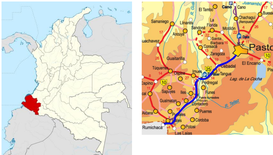
Figura 1 – Localización general del Proyecto