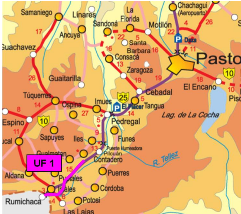
Figura 2 - Localización general de las Unidades Funcionales