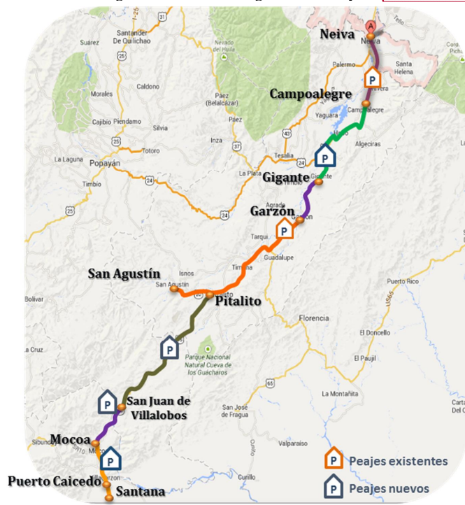
Figura 1 ó Localización general del Proyecto.