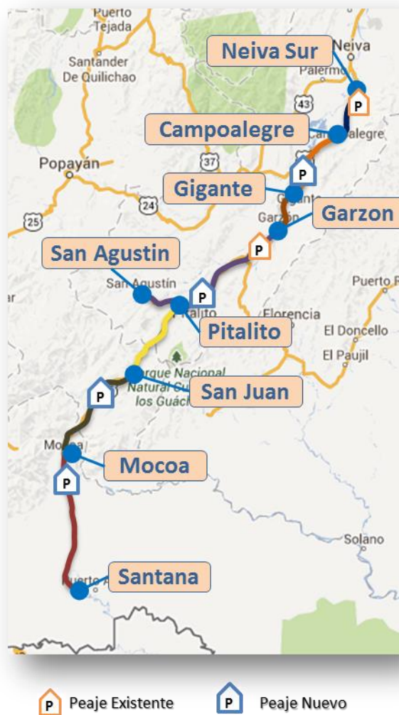
Figura 1 – Localización general del Proyecto