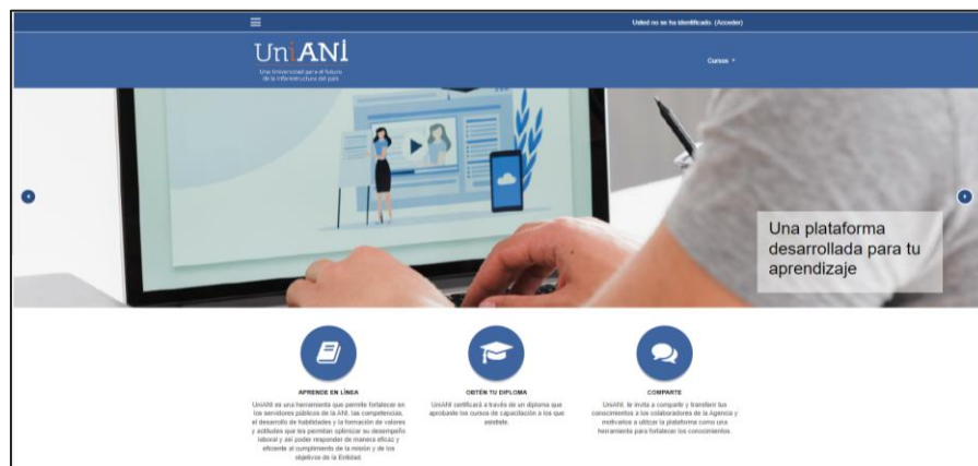
Imagen 2. Plataforma Una universidad para el futuro de la infraestructura del país