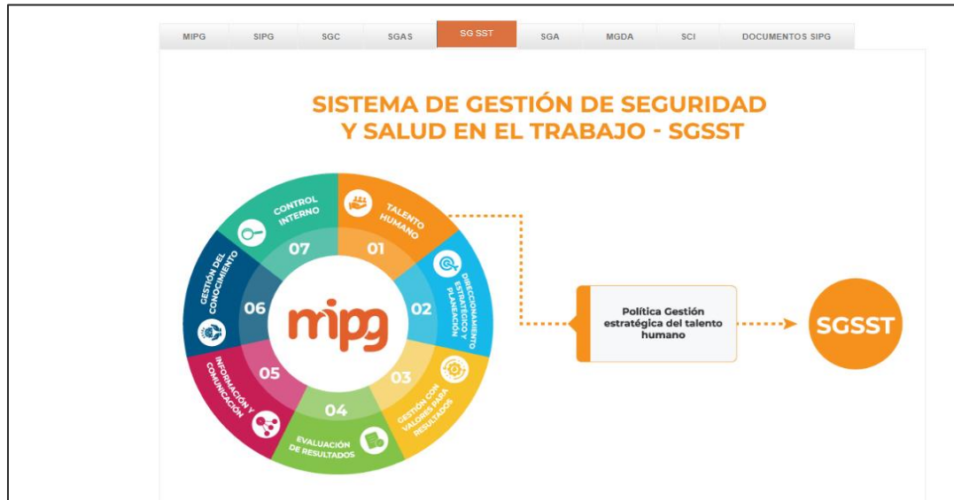
Imagen 3. Modelo integrado de planeación y gestión -SGSST

https://www.ani.gov.co/modelo-integrado-de-planeacion-y-gestion