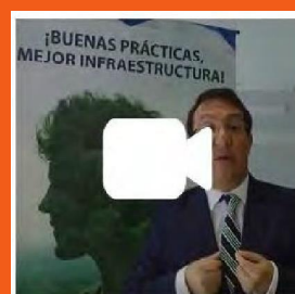
INVITACIÓN: PREMIO SUPERVISORES 2017

Para ver todos los mensajes sobre este Premio, haga clic sobre cada imagen: