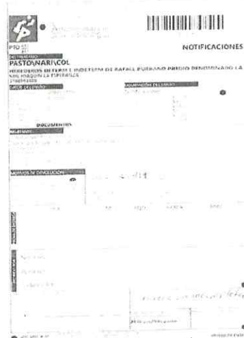
IMAGEN PRUEBA DE ENTREGA DE LA DEVOLUCIÓN