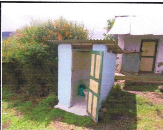
CONSTRUCCION 4 BAÑO