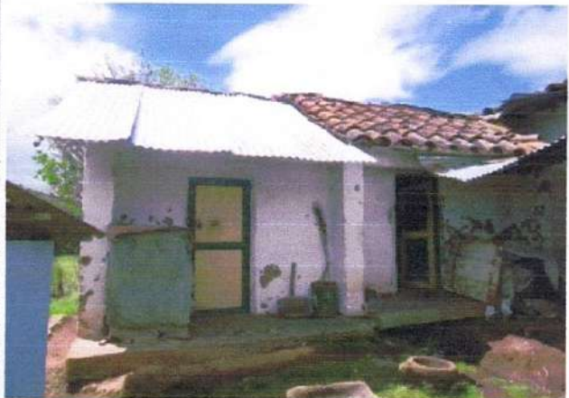
CONSTRUCCION 3 /