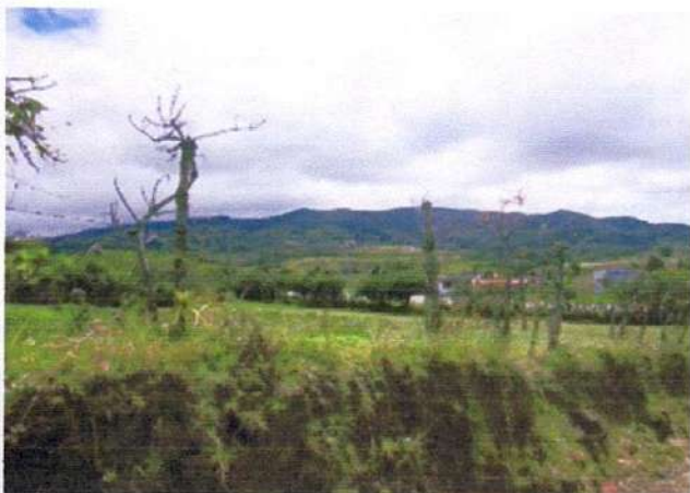
CERCA EN LECHERO Y ALAMBRE DE PUAS