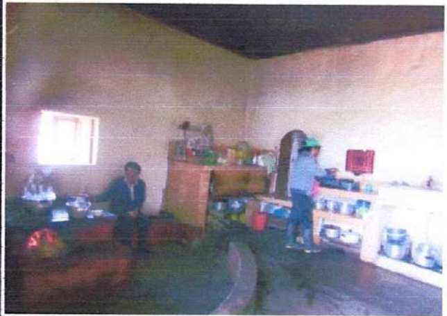
C1 COCINA DE LEÑA