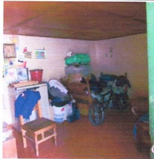
C2 HABITACIONES /