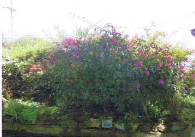
ESPECIES EXISTENTES ✓