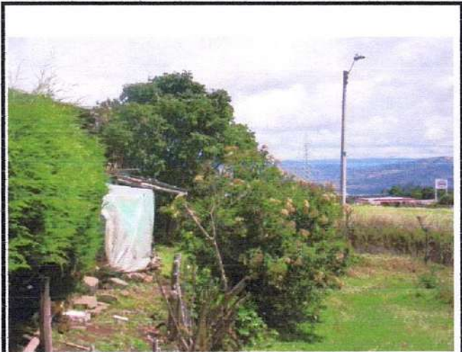
ESPECIES EXISTENTES CHILCA