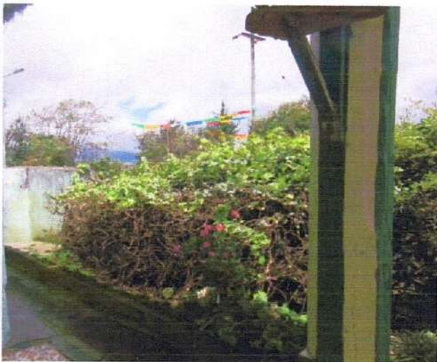
MANO DE PATO Y GERANIOS