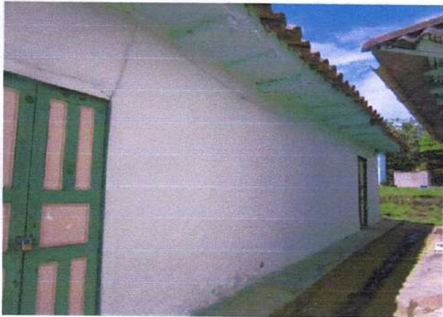
CONSTRUCCION 2 /