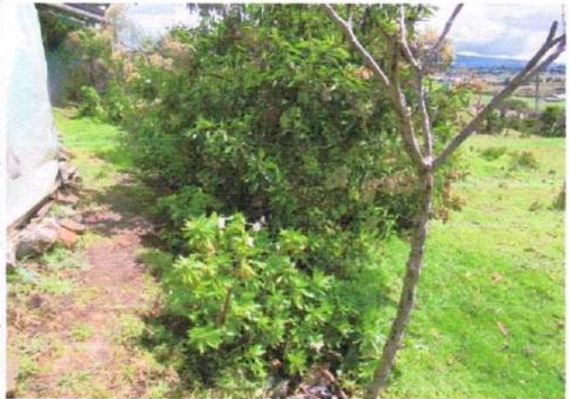
ESPECIES EXISTENTES ✓