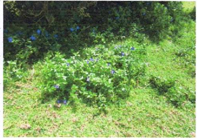
ESPECIES EXISTENTES ✓