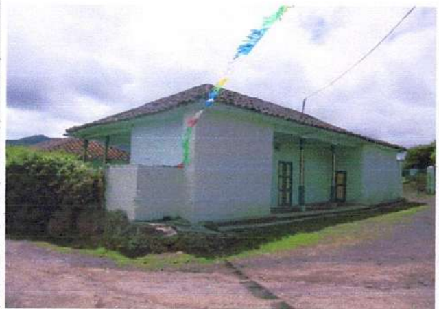
CONSTRUCCION 1 ✓