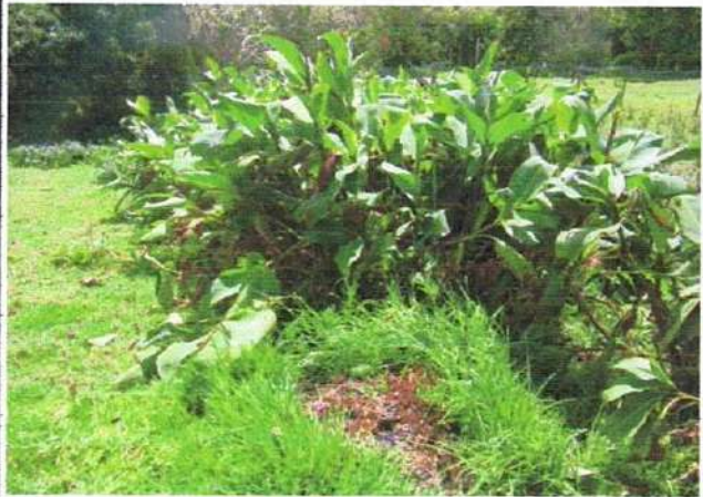
MATA DE ANTURIO