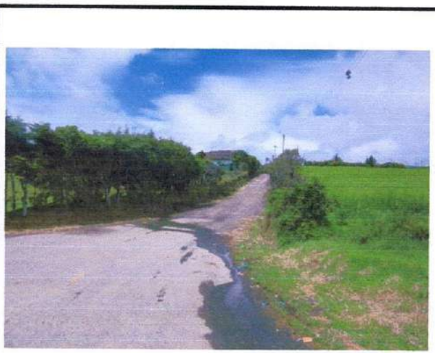
CARRETEABLE ACCESO AL PREDIO ✓