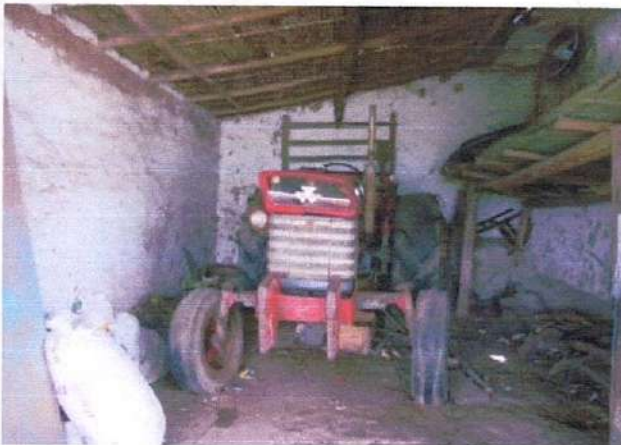
C2 BODEGA /