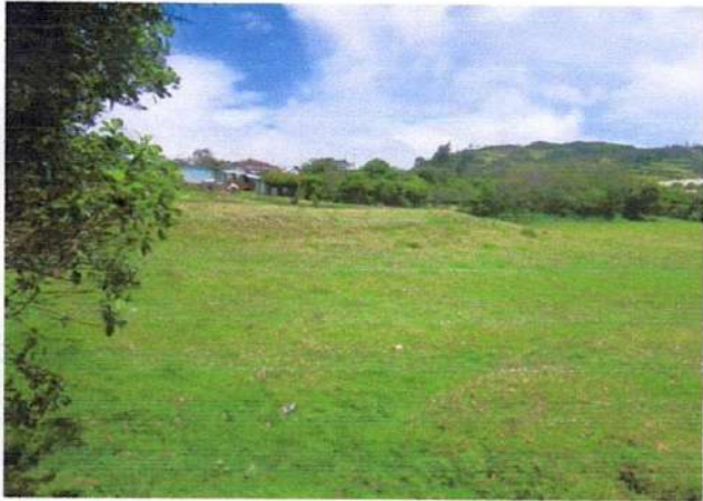
VISTA GENERAL DEL PREDIO ✓