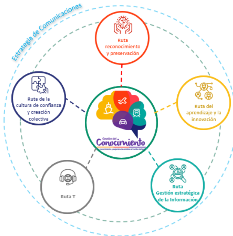
Figura 3. Rutas estrategia Gestión del Conocimiento y la Innovación.