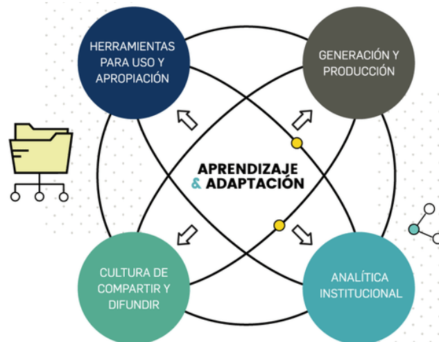
Figura 2. Ejes GC Política MIPG. 5