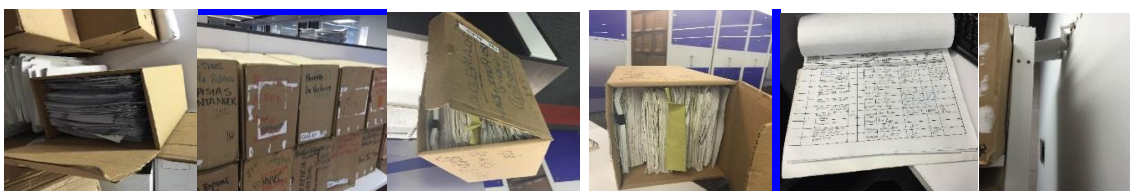
Ilustración 1 Estado de la información, cajas, carpeta de préstamos y archivador